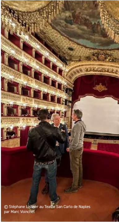
© Stéphane Lissner au Teatro San Carlo de Naples par Marc Voinchet