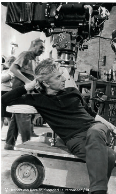
© Herbert von Karajan, Siegfried Lauterwasser / DG

Figures de légende, compositrices et/ou compositeurs de génie, grands noms de l'histoire de la musique, lieux de création... Chaque semaine, une série thématique déroule le fil d'une histoire. Rendez-vous 7 jours sur 7 de 9h à 10h30 pour (re)découvrir des personnalités, célébrer des anniversaires, convoquer la mémoire... Avec, toujours, la promesse de riches heures musicales.