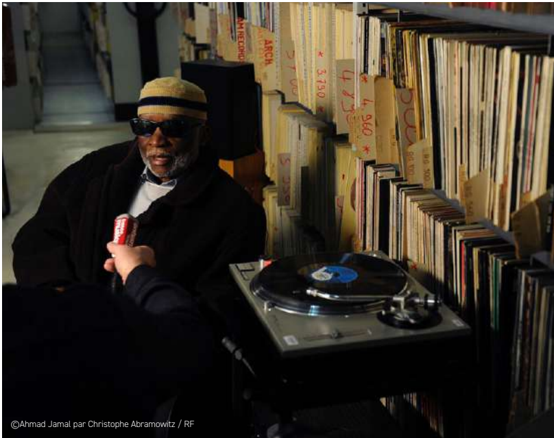
©Ahmad Jamal